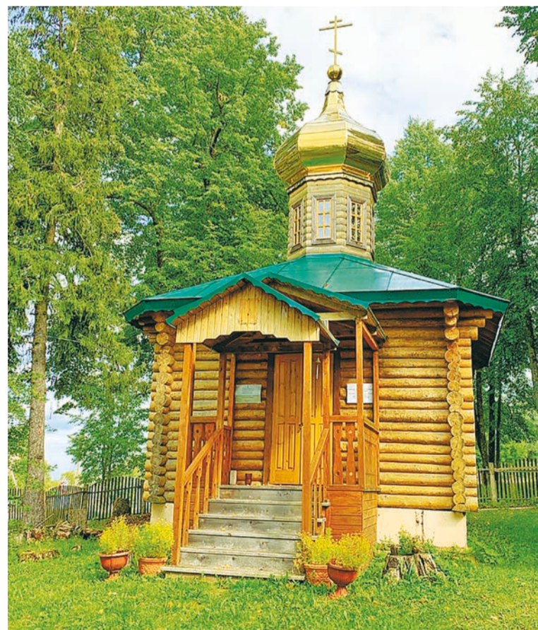
Часовня в честь святых царственных страстотерпцев в д. Железково